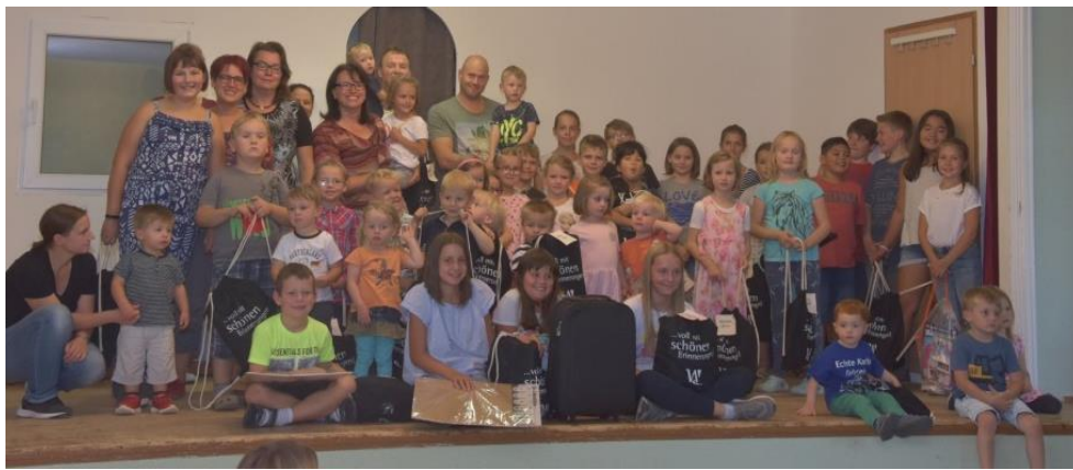
Ferienpass-Prämierung anlässlich des Kaffeenachmittags 2018