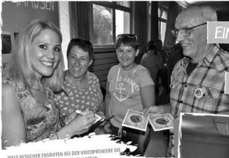
VIELE BESUCHER ERGRIFFEN BEI DER VIDEOPREMIERE DIE CHANCE SICH IHRE CD SIGNIEREN ZU LASSEN.