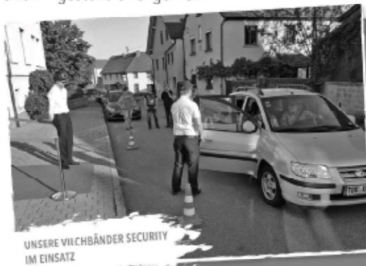
UNSERE VILCHBÄNDER SECURITY IM EINSATZ

sam auf dem Weindorf gerockt. Auch die darauf folgende Videopremiere war ein voller Erfolg und brachte die Gemeinde, bei Snacks, kühlen Getränken und netten Gesprächen zusammen.