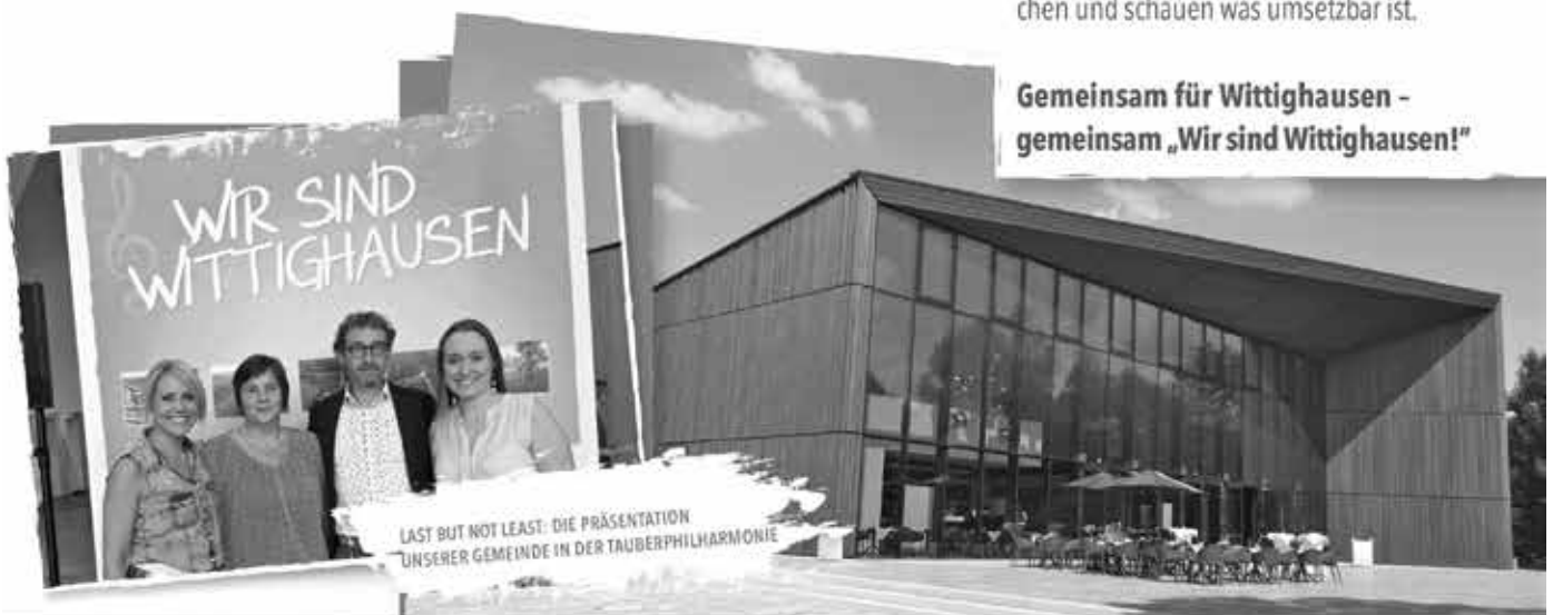
LAST BUT NOT LEAST: DIE PRÄSENTATION UNSERER GEMEINDE IN DER TAUBERPHILHARMONIE

Gemeinsam für Wittighausen - gemeinsam „Wir sind Wittighausen!“