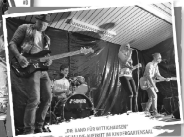
„DIE BAND FÜR WITTIGHAUSEN“ BEIM LIVE-AUFTRITT IM KINDERGARTENSAAL

Hinter uns liegen neue Erfahrungen, aufregende Wochen, viele schöne und unvergessliche Erlebnisse. Aus einer Projektgruppe wurde ein „Team für Wittighausen“, das mit Leidenschaft und Kreativität über Monate unermüdlich nach dem Motto „Gemeinsam für Wittighausen“ zusammengearbeitet hat. Was ursprünglich zur Präsentation unserer Gemeinde im Eröffnungssommer der neuen Tauberphilharmonie in Weikersheim geplant war wurde so viel mehr. Es wurde ein