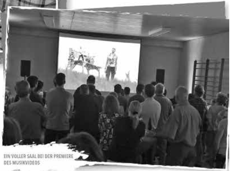
EIN VOLLER SAAL BEI DER PREMIERE DES MUSIKVIDEOS

wurde unser Song gespielt und auch in Weikersheim sangen viele Besucher den Refrain mit. Das dortige Feedback, angefangen mit den Worten „Wittighausen ist vielleicht die kleinste Gemeinde im Main-Tauber-Kreis, aber die Gemeinde, die mit ihrer Präsentation hier bei uns die Messlatte deutlich angehoben hat,“ gefolgt von den Worten, dass wir auf eine völlig neue Art und Weise ein Imagevideo geschaffen hätten, wie es noch keine Gemeinde hat und dies von unschätzbarem Wert sei, war das Feedback nach dem Auftritt. Dies freut uns natürlich sehr.